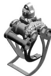
Stein- und Holzgreifer